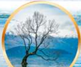
ถ่ายรูปต้นวานาก้าผู้โดดเดี่ยว ที่ทะเลสาบวานาก้า