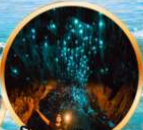
ดูหมอลงเรือแสง โวกีโท

10 D | 22-31 ก.ค. 69 (วันเฉลิมฯ, อาสาพหุชา, เข้าพรรษา) 8 N | 08-17 ส.ค. 69 (วันแม่แห่งชาติ)