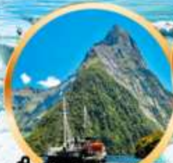
นั่งเรือชมความงาม ฟยอร์ดแห่ง มิลฟอร์ด ซาวด์