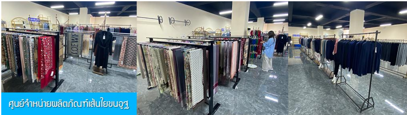
ศูนย์จำหน่ายผลิตภัณฑ์เส้นใยขนอูฐ