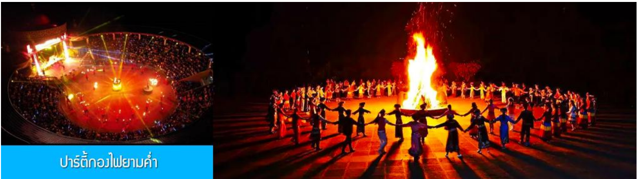
ปาร์ตี้กองไฟยามค่ำ