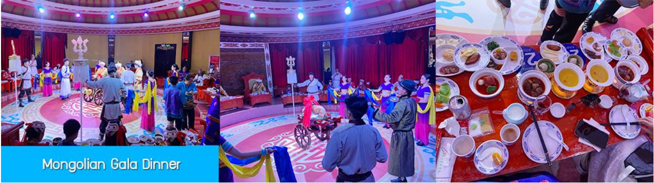
Mongolian Gala Dinner