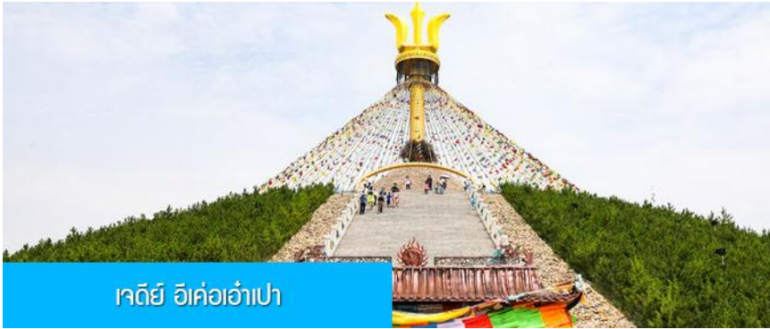
เจดีย์ อี้เค่อเอาเป่า

พักที่ DALAETQI SHNAGJING HOTEL โรงแรมระดับ 4 ดาวหรือเทียบเท่าในเมืองต้าลาเท่อ