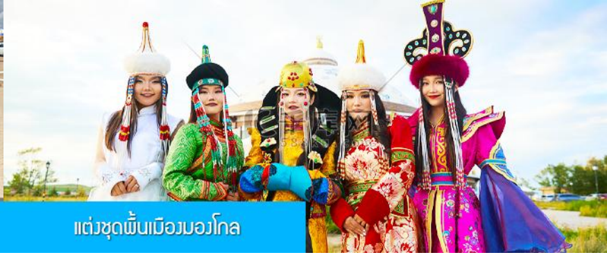
แต่งชุดพื้นเมืองมองโกล