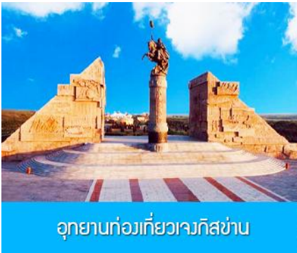
อุทยานท่องเที่ยวเจงกิสข่าน