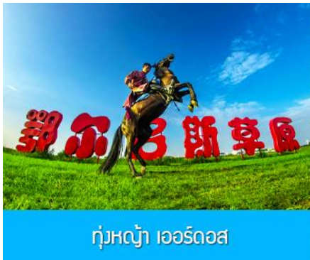
ทุ่งหญ้า เออร์ดอส

พักที่ ORDOS BOYU AIRUI HOTEL โรงแรมระดับ 4 ดาวท้องถิ่น หรือเทียบเท่าในเมืองเออร์ดอส