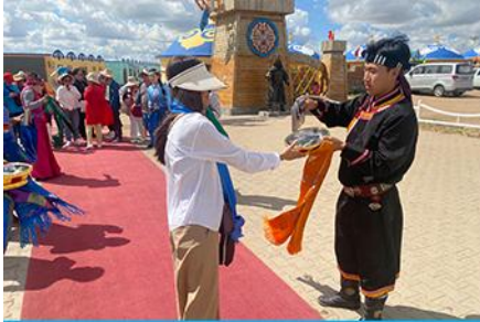
พิธีต้อนรับแขกด้วยเหล้า