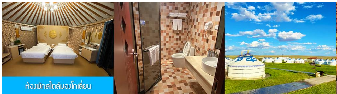
ห้องพักสไตล์มองโกลสมัย