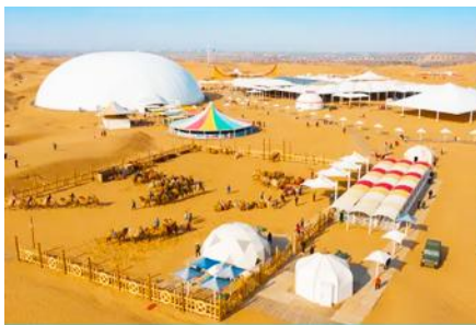
เกาะกลางทะเลทรายเขียนซาเต๋า