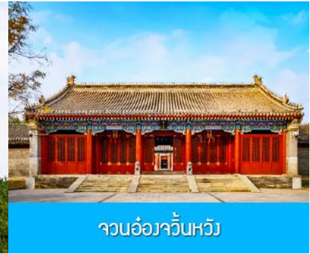
จวนอ๋องจวินหวัง

วันที่หก เมืองเออร์ดอส –อี้เค่อเอาเป่า–จวนอ๋องจวินหวัง- สวนวัฒนธรรมหมงกู่หยวนหลิว- ช้อปปิ้งถนนคนเดิน