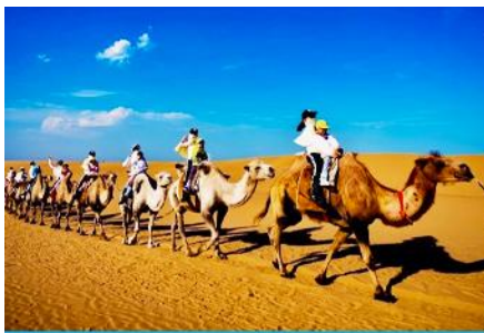
เป็นทรายเสียงชาวาน