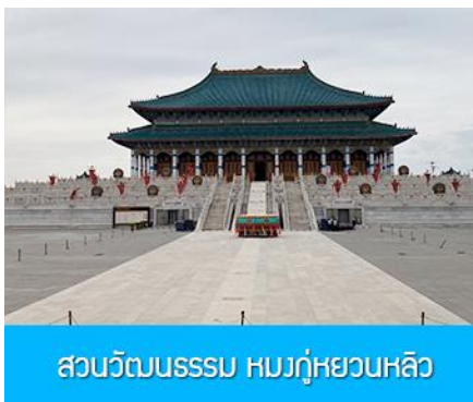
สวนวัฒนธรรม หมงกู่หยวนหลิว

เที่ยง รับประทานอาหารกลางวัน ณ ภัตตาคาร (14) หลังอาหารนำท่าน เที่ยวชม จวนอ๋องจวินหวัง 郡王府 จวนแห่งนี้เริ่มสร้างขึ้นในปี ค.ศ. 1902 สร้างเสร็จในปี ค.ศ. 1936 เป็นที่พำนักของ อ๋องอี้จวินหวัง 伊旗郡王 เป็นจวนอ๋องเพียงหนึ่งเดียวที่ได้รับการอนุรักษ์ในสภาพที่สมบูรณ์ โครงสร้างทำด้วยอิฐ หิน และไม้ ประกอบด้วยห้องพัก 16 ห้อง เป็นสถาปัตยกรรมผสมแบบมองโกลทิเบต และฮั่น