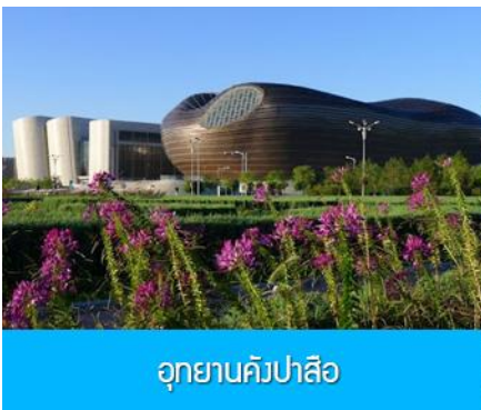
อุทยานคังปาสือ