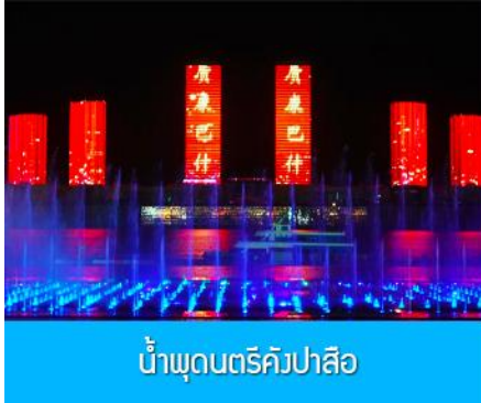
น้ำพุดนตรีคังปาสือ