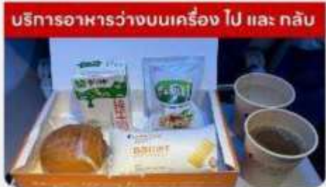
บริการอาหารว่างบนเครื่องบิน ไป และ กลับ