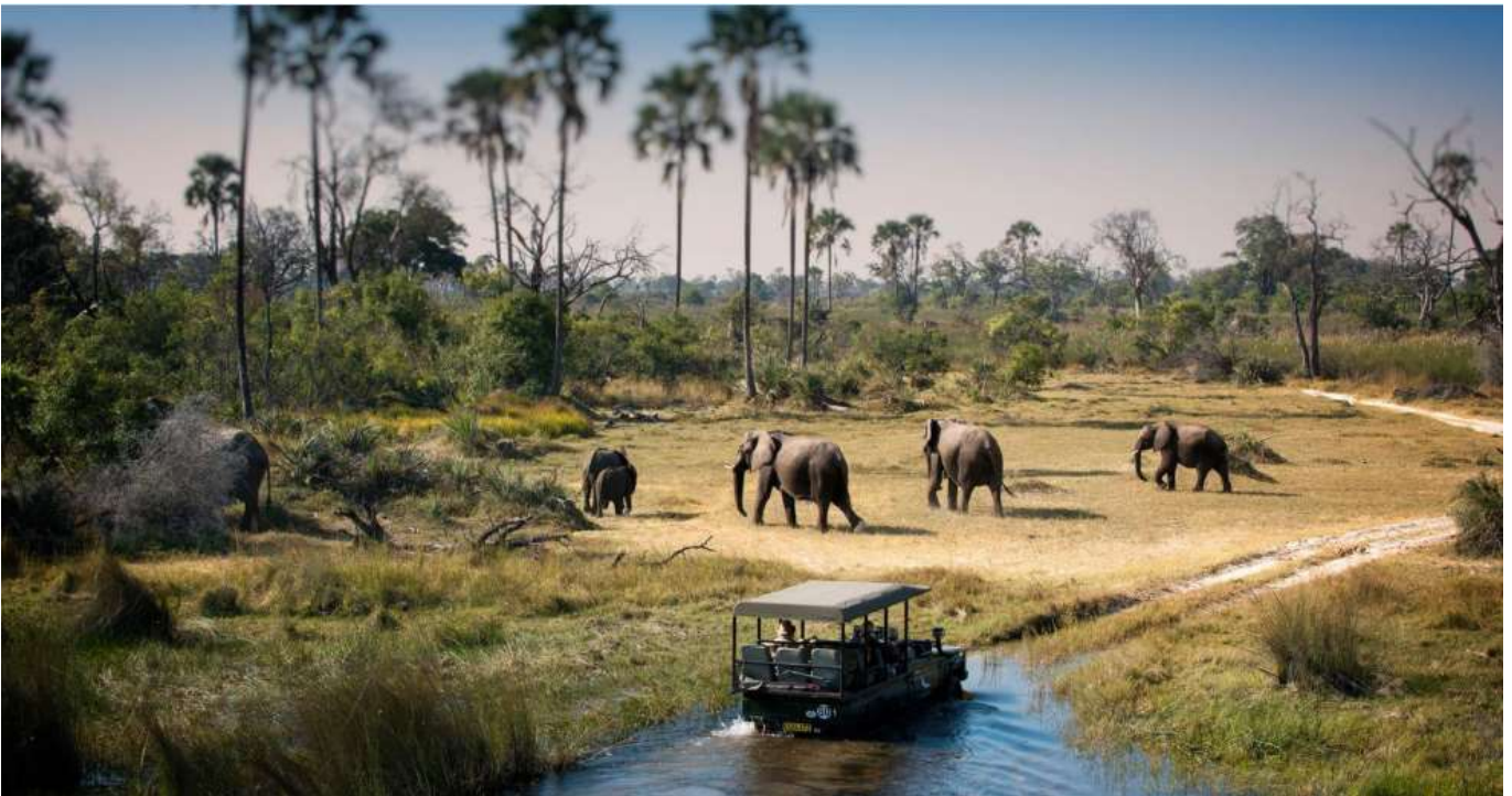
วันหยุดที่ดีที่สุดที่ 20 สิงหาคม 2569 Chobe National Park Botswana - Zambezi Sundowner cruise