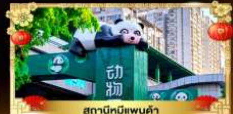
สถานีหมีแพนด้า