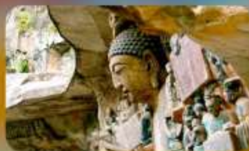
ฆาตินแกะสลักต้าจู้