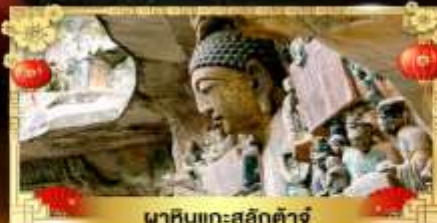
นาหินแกะสลักต้าจู่