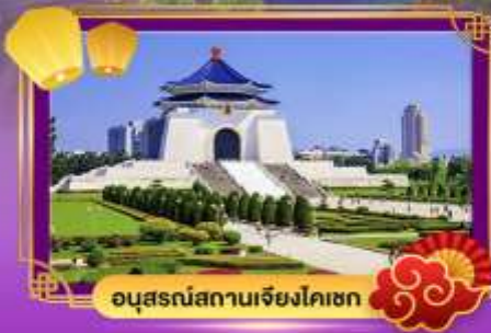
อนุสรณ์สถานเจียง ไคเชก