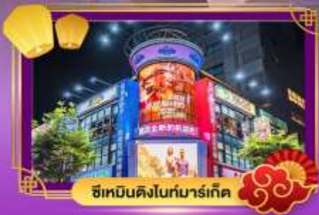
ซีเหมินดิงไนท์มาร์เก็ต