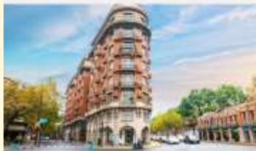
ถนนอู่คัง