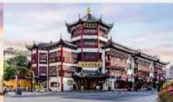
ตลาดร้อยปีเงินหวงเมี่ยว