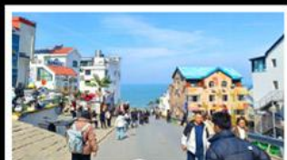
ถนนคอปเปลิ่งหมายเลข ๘

สัมผัสความยิ่งใหญ่ของ 4 เมืองสำคัญ ชิงเต่า - เยียนโก - เฟิงไห่ - เว่ยไห่ ปาต้ากวน - โบสถ์คาทอลิก - ตึกเก่าริมหา