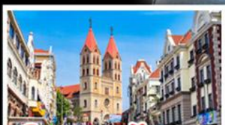
โบสถ์เซนต์ไมเคิล