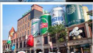
โรงเบียร์ชิงเต่า