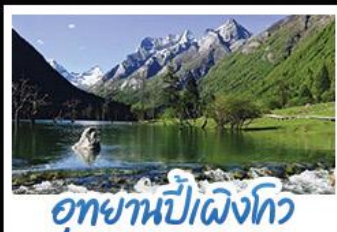
อุกยานปักเฉิงโกว

ภูเขาสัปดาห์นี้ อุกยานจิวจ้ายโกว นั่งรถไฟความเร็วสูง น้ำพุไม่ไผ่ตักSKP อุกยานปักเฉิงโกว วัดต้าฉือ ถนนโบราณชอยกวางชอยแคบ ช้อปปิ้งถนนไถ่กู่หลี่ + ถนนซุนซี้ลู่