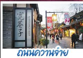
ถนนควานจ้าย