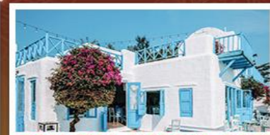
SON TRA MARINA CAFE