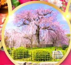
สวนสาธารณะมารุยามะ