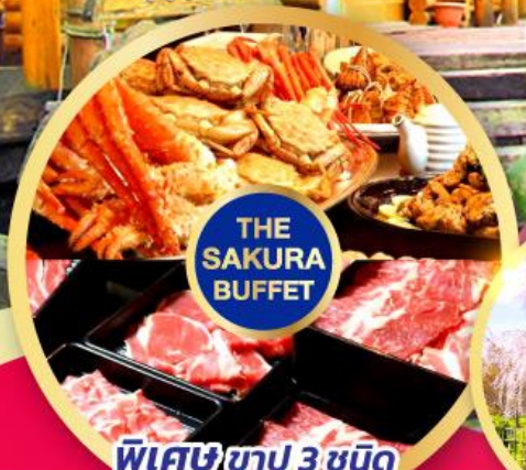
THE SAKURA BUFFET