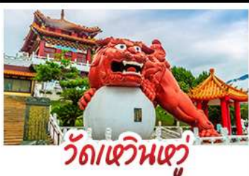
วัดเหวินหู