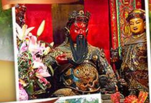
วัดหลินพักง