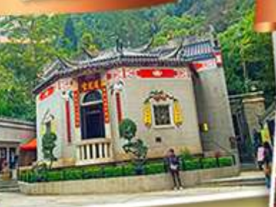
องค์อ้อยส้ม