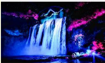
อุทยานน้ำตกหวงกั๋วซู่