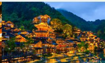
หมู่บ้านโบราณวูเจียงจ้าย