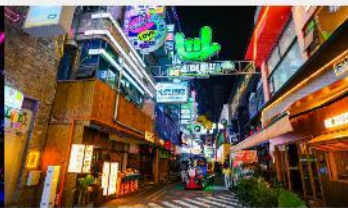
ถนนคนเดินซิงหยุน