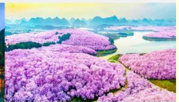
ชากรุง-ผิงป้า

*ทางบริษัทฯ ขอสงวนสิทธิ์ในการสลับโปรแกรมทัวร์ตามความเหมาะสมขึ้นอยู่กับสถานการณ์หน้างาน โดยคำนึงถึงผลประโยชน์ของลูกค้าเป็นสำคัญ