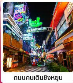
ถนนคนเดินซิงหยุน

• โฮเทล ส่วนซากุระผิงปา หนึ่งในสถานที่ชมดอกซากุระที่ใหญ่ที่สุดในโลก น้ำตกสวยระดับ 5A น้ำตกหวงกั๋วซู่ หมู่บ้านจีนโบราณ วูเจียงจ้าย