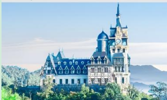
ปราสาทตามด้าว