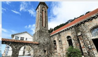
โบสถ์หินตามด้าว