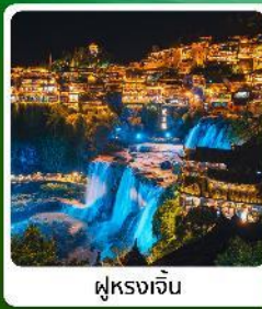
ฟูรงเจิน