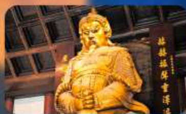
วัดเซ่งกงหมิว