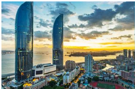
นครซีเยเหมิน

23.30 น. คณะเดินทางพร้อมกันที่ ท่าอากาศยานสุวรรณภูมิ อาคารผู้โดยสารขาออกชั้น 4 ประตูหมายเลข 10 เคาน์เตอร์ เช็คอิน สายการบิน XIAMEN AIRLINES (MF) เจ้าหน้าที่บริษัทฯ คอยให้การต้อนรับและอำนวยความสะดวกในการเช็คอิน