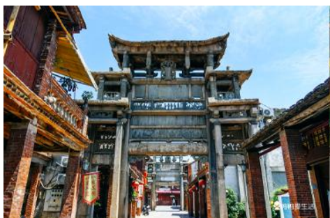
ถนนโบราณหมิงชิงแห่งเมืองจางโจว