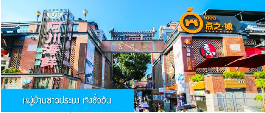
หมู่บ้านชาวประมง เจิงชว้ออัน