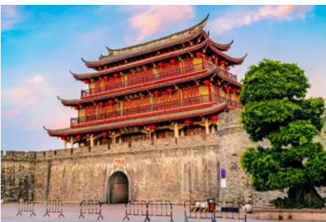
เมืองโบราณเต้จิว

พักที่ โรงแรม HAKKA TULOU PRINCE HOTEL 4* หรือเทียบเท่าในเมืองหย่งตั้ง