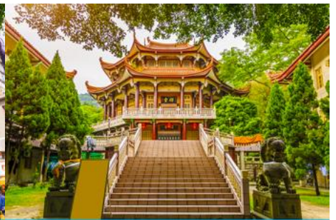
วัดหนานกัวซื่อ