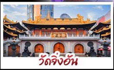
วัดจิ่งอัน