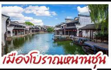
เมืองโบราณหนานชุน

DISNEYLAND SHANGHAI เต็มวัน เมืองโบราณหนานชุน (รวมล่องเรือ) - วัดจิ่งอัน เมืองโบราณหนานชุน - ตลาดร้อยปีเฉิงหวังเหมียว มือพิเศษ บุฟเฟต์ BBQ, เสี่ยวหลงเปา