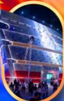
เรือคอะหลุยส์