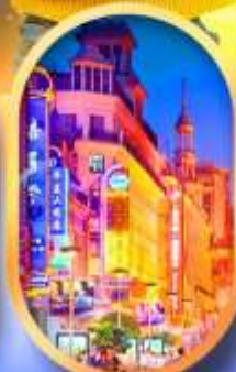
ถนนหนานกิง