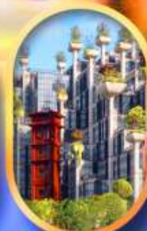
อาคาร 1,000 คับไม้