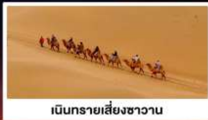
เนินทรายเสี่ยงซาวาน