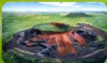
ภูเขาไฟอูลันคา