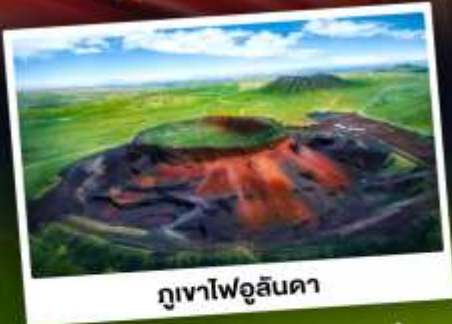
ภูเขาไฟอูลันดา

ท่องเที่ยวแดนแห่งทะเลทรายและทุ่งหญ้า ชมพระอาทิตย์ขึ้นที่ทุ่งหญ้าออร์ดอส