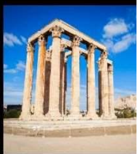
Temple Of Olympian