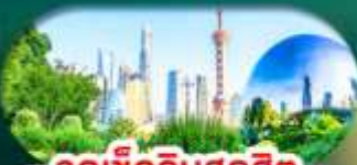
จุดเช็คอินสุดฮิต

เซี่ยงไฮ้ หางโจว ล่องทะเลสาบซีหู ฟรีเดย์