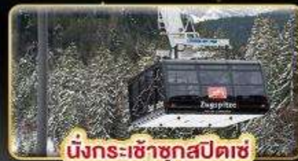
นั่งกระเช้าชุกสปีตซ์