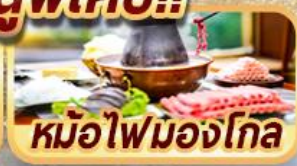
หม้อไฟมองโกล