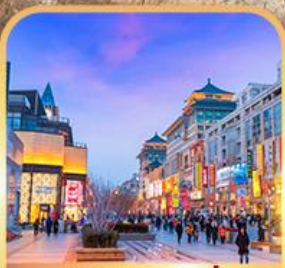
ถนนหวงฟู่จิ่ง