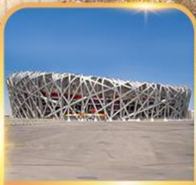
สนามกีฬาแห่งชาติ