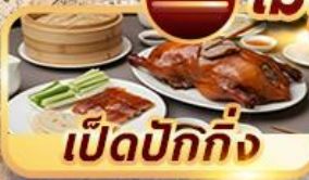
เป็ดปักกิ่ง