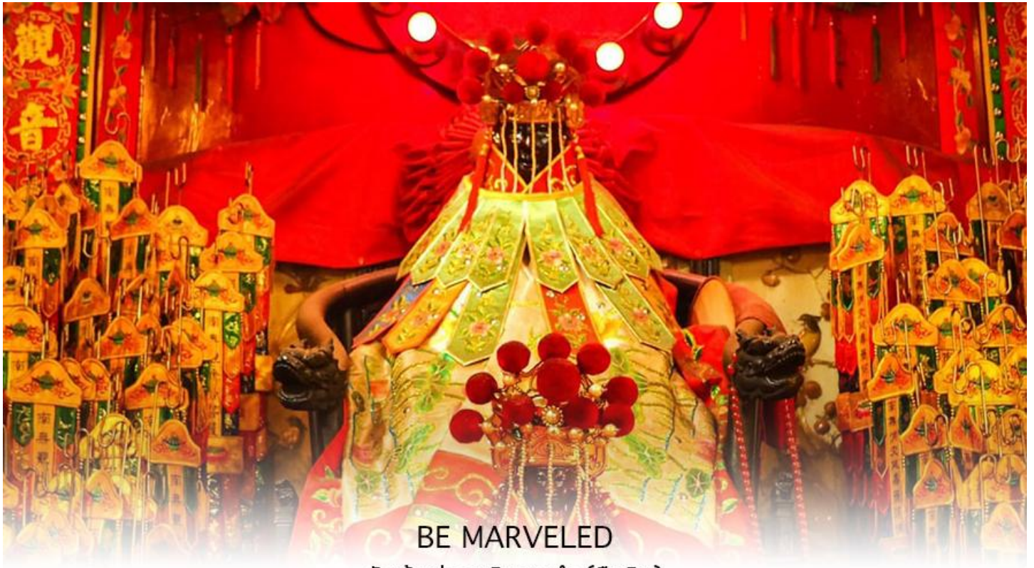
BE MARVELED วัดเจ้าแม่กวนอิมฮองอ่า (ยิมเมิน)

ลงบริเวณใกล้กับวัดแห่งนี้หลายต่อหลายครั้ง ทำให้มีผู้บาดเจ็บและล้มตายมากมาย แต่ชาวบ้านที่หนีเข้าไปหลบภัยในวัดนี้ก็กลับปลอดภัยอย่างปาฏิหาริย์ และตัววัดก็ไม่ได้ได้รับความเสียหายจากเหตุการณ์ที่ระเบิดอย่างน่าอัศจรรย์ ตามความเชื่อของคนจีนในฮ่องกง-มาเก๊า จะมี "วันเปิดทรัพย์" หรือ "พิธียืมเงิน เจ้าแม่กวนอิมฮ่องกง" เป็นวันที่จะมาขอพรและยืมเงินเจ้าแม่กวนอิมซึ่งนับจากหลังวันตรุษจีน ไป 26 วัน จะเป็นวันเปิดทรัพย์ที่จัดขึ้นในทุกๆปี พิธีนี้จะมีเพียงครั้งปีละครั้งเท่านั้น เป็นวันสำคัญอีกวันที่คนหลังไหลมาไหว้ขอพรอย่างไม่ขาดสาย