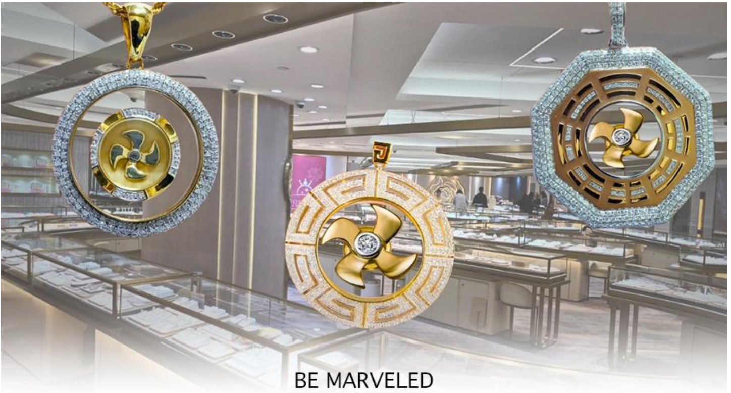
BE MARVELED ศูนย์ฮวงจุ้ย กังหันเศรษฐี

และนำท่านชม ศูนย์ปีเซี่ยะ ซึ่งคนจีนนั้น ถือว่าหยกเป็นหิน ที่เป็นตัวแทนของความสวยงามและความบริสุทธิ์มีความเชื่อว่าหยก มงคล ถ้าพกติดตัวไว้จะอายุยืนและสุขภาพดีมีสินค้ำมากมายเกี่ยวกับหยก อาทิ กำไลหยก หรือสัตว์นำโชคอย่างปีเซี่ยะ ให้ท่านได้เลือกซื้อเป็นของฝาก, ของที่ระลึก หรือของนำโชคแต่ตัวท่านเอง