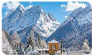
ภูเขาหิมะครุณี