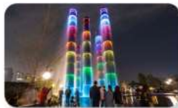
น้ำพุไม้ไผ่