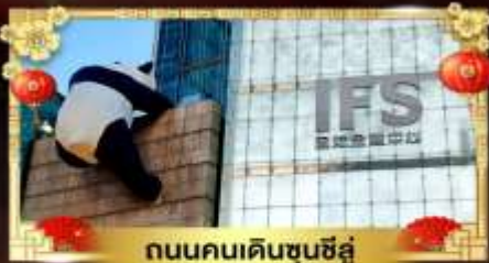
ถนนคนเดินชุนชี่อู่

เที่ยวอุทยานสวรรค์ระดับ 5A จิวจ้ายโกว "ภูเขาสี่ดรุณี" อุทยานชื่อดังเหนียงชาน