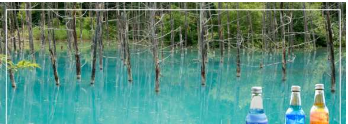
BLUE POND สระอะโออิเคะ

จากนั้นนำท่านชม สระอะโออิเคะ (Aoiike) หรือที่เราจะรู้จักกันอีกชื่อหนึ่งว่า "สระน้ำสีฟ้า (Blue Pond)" ห่างจากเทือกเขา Tokachi ประมาณ 2.5 กิโลเมตร นับเป็นแหล่งท่องเที่ยวที่เหมาะสมกับนักท่องเที่ยวสายสงบส่วนมากคนที่จะมาเที่ยวก็จะเป็นนักท่องเที่ยวต่างชาติ สาเหตุที่มีชื่อว่า สระอะโออิเคะ (Aoiike) หรือสระน้ำสีฟ้า (Blue Pond) นั้นก็เพราะว่ามีการตั้งชื่อตามสีของน้ำที่เกิดจากแร่ธาตุตามธรรมชาตินั่นเองโดยน้ำในส่วนนี้เพิ่งเกิดขึ้นจากการกันเขื่อนเพื่อป้องกันไม่ให้โคลนภูเขาไฟ Tokachi ที่ปะทุขึ้นเมื่อปี ค.ศ. 1988 ที่ไหลทะลักเข้าสู่เมืองนั่นเอง