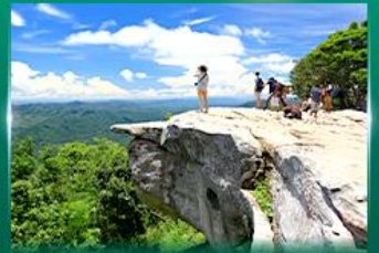
จุดชมวิวกว๊านสุพรรณแผ่นดิน